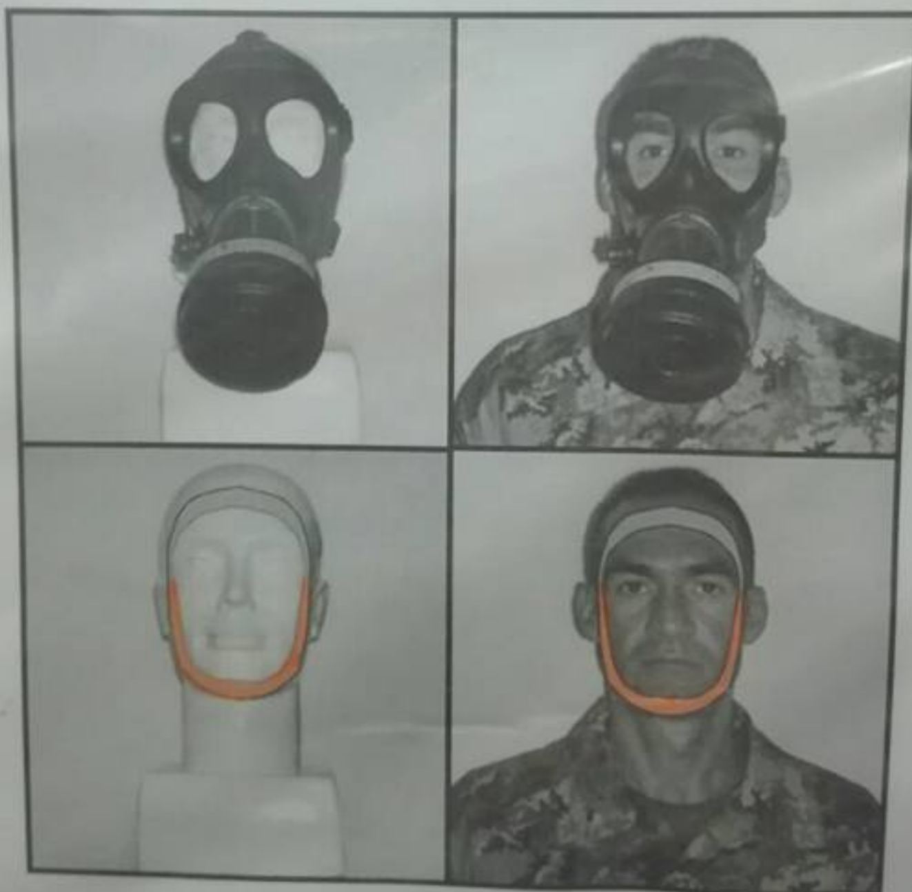
Figura 14: bordo di tenuta (vista frontale)

Il personale deve indossare la maschera anti-NBC modello M90, senza barba o altri elementi piliferi frapposti tra il bordo di tenuta e il viso (figura 14) al fine di garantire il MASSIMO LIVELLO DI TENUTA REALIZZABILE.