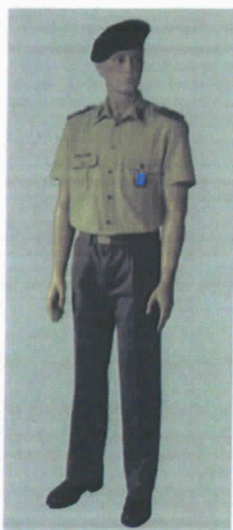
Uniforme di Servizio Estiva (S.E.) maschile.