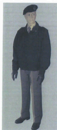
Uniforme derivata dall'Uniforme di Servizio Invernale con giubbino di servizio all'interno e all'esterno delle installazioni.