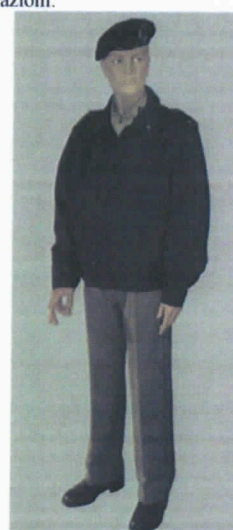
Uniforme derivata dall'Uniforme di Servizio Estiva con giubbino di servizio all'interno e all'esterno delle installazioni.