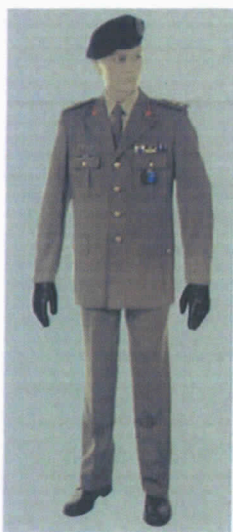
Uniforme di Servizio Invernale (S.I.) maschile.