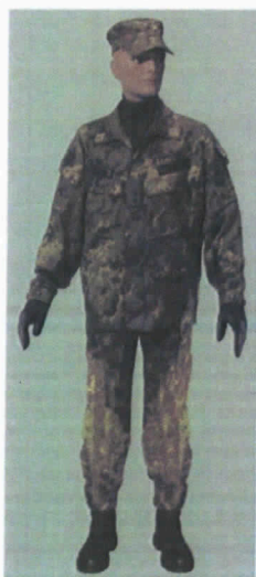
Uniforme SC. Versione "Servizio" Invernale (SC.S.I.). – con berretto con visiera ovvero basco o copricapo di specialità. In caso di condimeteo avverse può essere autorizzato l'uso della sopravvestito policromo.