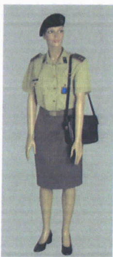
Uniforme di Servizio Estiva (S.E.) femminile con gonna.