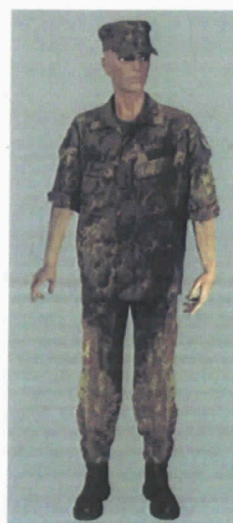
Uniforme SC. Versione "Servizio" Estiva (SC.S.E.) – con berretto con visiera ovvero basco o copricapo di specialità. In caso di condimeteo avverse può essere autorizzato l'uso della sopravvestito policromo.