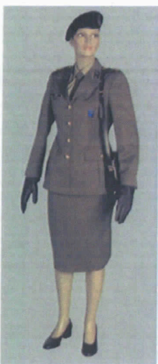
Uniforme di Servizio Invernale (S.I.) femminile con gonna.