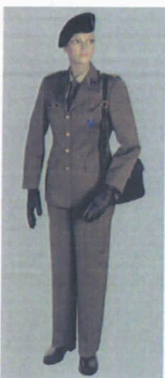
Uniforme di Servizio Invernale (S.I.) femminile con pantalone.