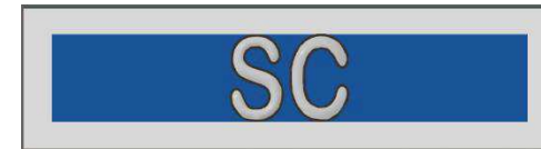
Fig. 11 Distintivo di incarico su nastro per il servizio prestato da Sottufficiale di Corpo dell'Esercito