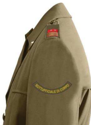
Fig. 4 esempio su soprabito