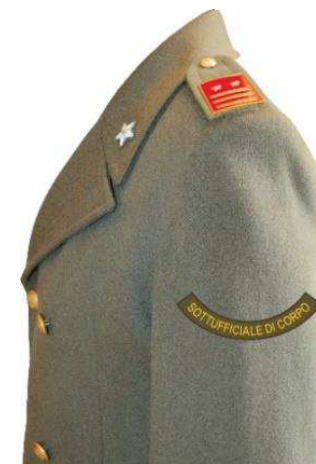
Fig. 3 esempio su cappotto