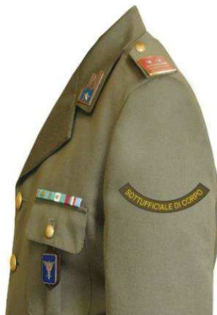
Fig. 1 esempio su uniforme ordinaria