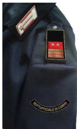
Fig. 5 esempio su giubbino di servizio