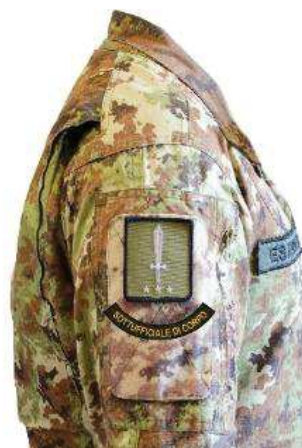
Fig. 2 esempio su uniforme di servizio e combattimento