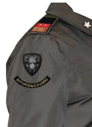
Fig. 6 esempio su impermeabile modello 2016